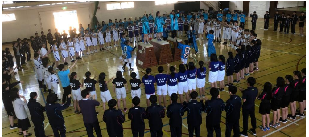
恒例の全校円陣。生徒会チームの威勢のいい動きと声出しにのって、全校が一丸となる瞬間。

さて、この部活動。いよいよその夏の総決算期を迎えるにあたり、過日25日(火)、市中体連の開催に向けた壮行会を行いました。各部の決意表明、応援団(生徒会)によるエール、そして最後には「全校円陣」を組んで互いに鼓舞しながら、これまでの自分たちの頑張りを讃え合いました。同じ夢に向かって気持ちを一つにして挑む大空の子ども達の姿は自信と希望に満ちている様子さえ感じます。選手も応援する人も「チーム大空中学校」として、一つになって頑張る姿を期待しています。〈参考文献〉 思いに届く校長の言葉(昌三出版)