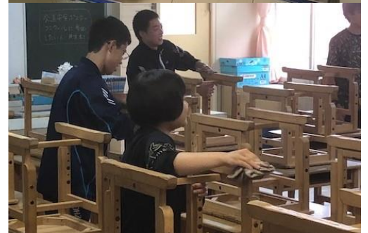
学期末大掃除の様子から。よくはたらく大空の子。 家でのお手伝いもしてほしいです。