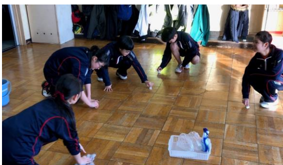
大空の子はよくはたらく 24日(火)大掃除から。年末の家の大掃除も貴重な働き手になりそう

子年（ねずみどし）の新年、令和2年には、1、2年生は進級してそれぞれ2年生、3年生になり、何といても3年生は高等学校に進学する、大きな節目を迎えます。目標を達成するよい年にするために、まさにこの「正」の字をもって、一人一人が「一」にあたる年の初めの目標を立て、さいごまであきらめず、がんばり抜いてほしいと思います。