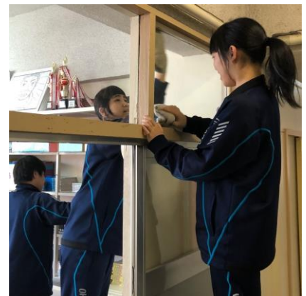
大空の子はよくはたらく 24日(火)大掃除から